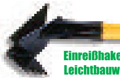
Einreißhaken für Leichtbauwände (DWH), optional