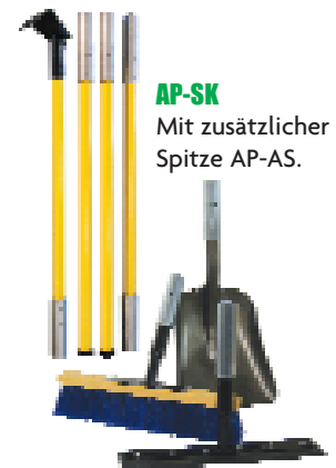
AP-SK Mit zusätzlicher Spitze AP-AS.