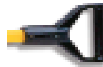
Bügelgriff (D), optional

UL-14-DWH = 14' UltraLite-Stiel (4,20 m) mit Einreißhaken für Leichtbauwände