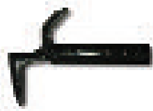
Mehrzweckhaken (MP), optional