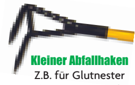
Kleiner Abfallhaken Z.B. für Glutnester (LARH), optional