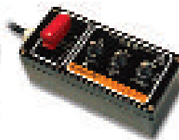
Anbau-Bedienelement mit Staufunktion