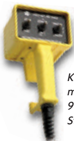
Kabelfernbedienung mit 27 m oder 91 m Kabel und Stecker