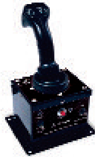
Joystick für Ventil, Staufunktion & Auto-Oszillation