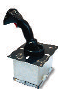
Einbau-Joystick für Ventil