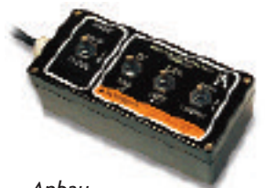
Anbau-Bedienelement für elektrisches Ventil