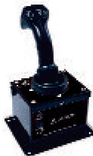
Anbau-Joystick für Ventil