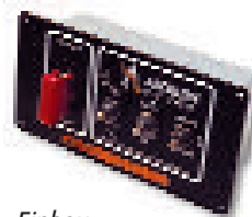
Einbau-Bedienelement mit Staufunktion