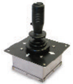
Standard-Joystick für Ventil